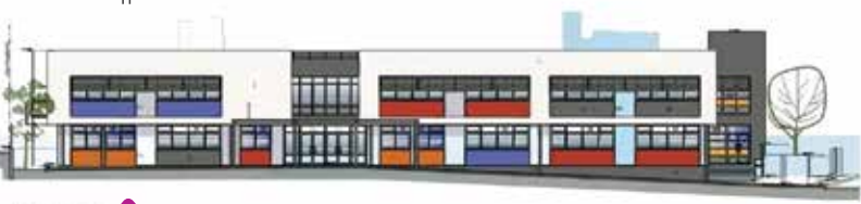
2 ο Γυμνάσιο Αρτέμιδος